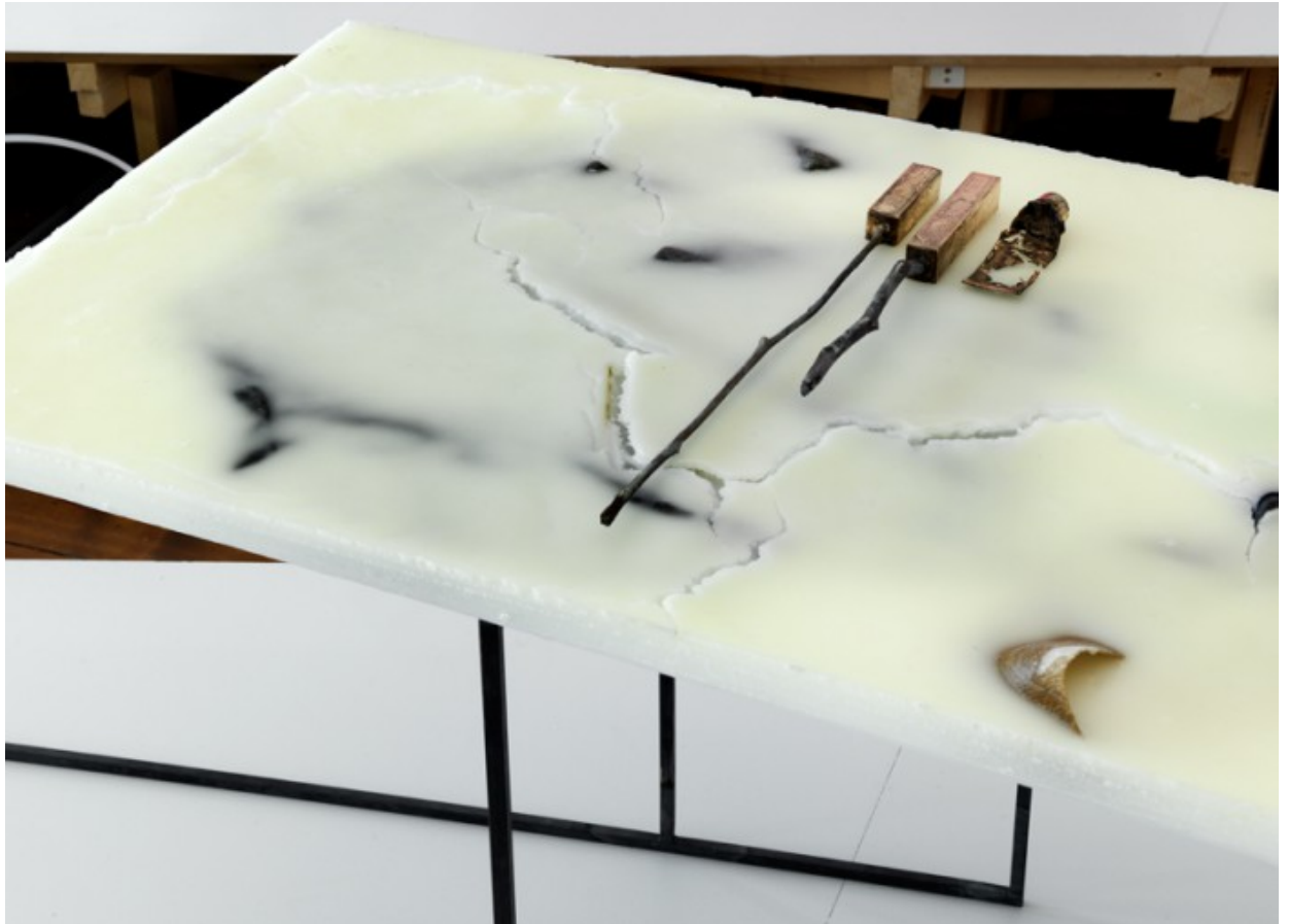
Saskia Noor van Imhoff: #+ 21.00